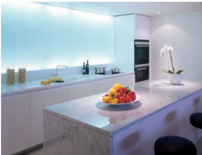
Albion Riverside, Architekt: Forster & Partners, London (UK)

Mobiliar, Trennwände, Duschwände, Türen, Fenster, Treppengeländer, Treppengeländer: SGG SATINOVO MATE bietet vielfältige Möglichkeiten, um den Wohnraum optimal zu gestalten.