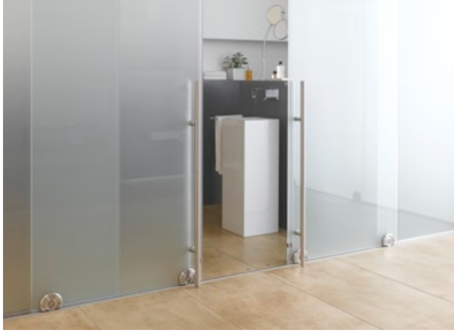
CASA, Münster (D)

SGG SATINOVO MATE wird durch eine Säurebehandlung der Glasoberfläche des Basisglases SGG PLANILUX hergestellt.