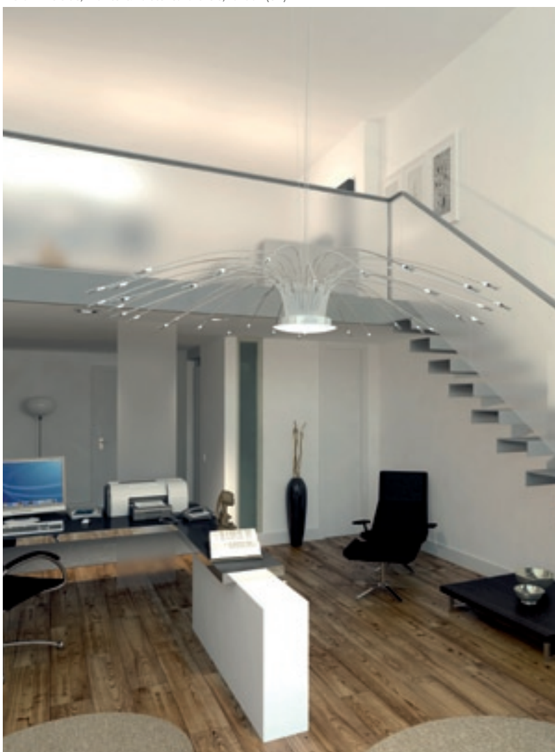
La Vaneciana Muro Cortina: Grafia Comunicacion, (E)