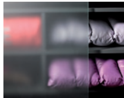
Boutique Calesta, Paris (FR)